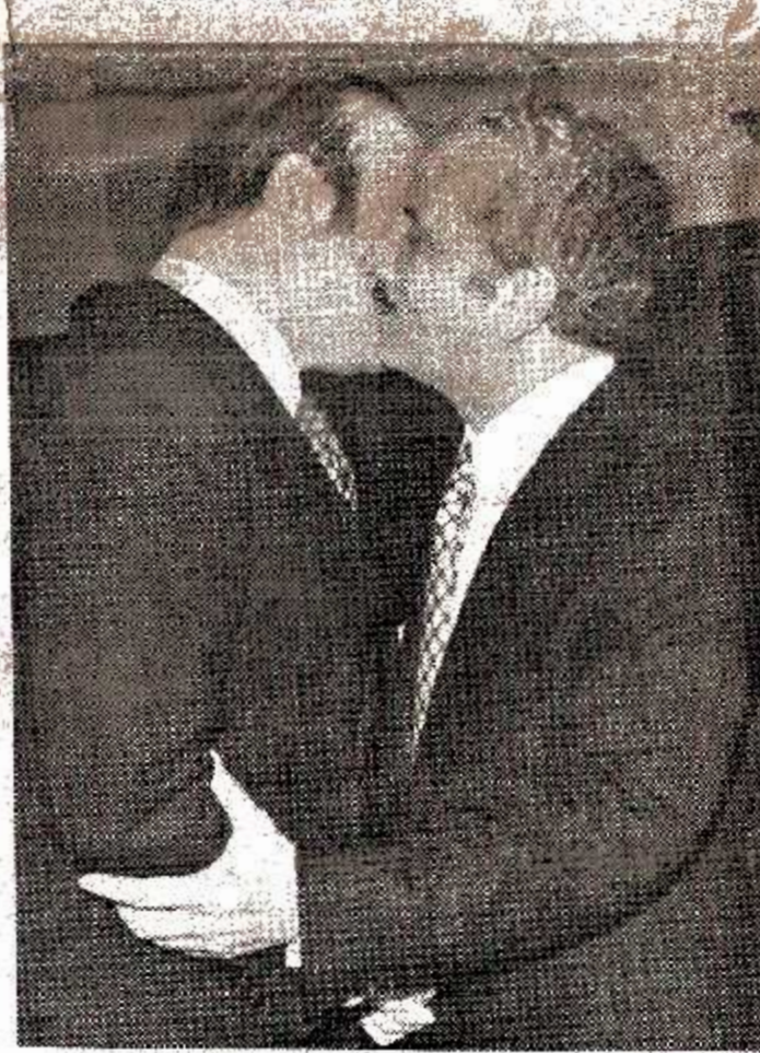
السيد احمد اللوزي بعينه السيد زيد الرفاعي رئيس الوزراء بالقبول الملكة - تصوير ١١ -

عمان - وا - صدرت الارادة الملكية السامية بقبول استقالة حكومة السيد احمد اللوزي رسالة اللوزي قد ربح السيد احمد اللوزي الرسالة التالية الى جلالة الملك الحسين : سدي صلب الحلالة الملك الحسين المعظم ايده الله يولي : بجهان الجندى بقا لدهه واخلاص المرائن ابريز حرا وطبقة ويحط امل امته انشرف بان ارفع الى مقامكم السامي استقالتي من منصبه . مؤكدا لجلالتكم ان الثقة الملكية الغالية التي اولموني اياها وزملائي من خلال خدمة العرش والوطن ستنهي ابداء امانة في اعناقنا في اي موقع من مواقع المسؤولية تكون فيه. البيعة ص ٢ ع ٨