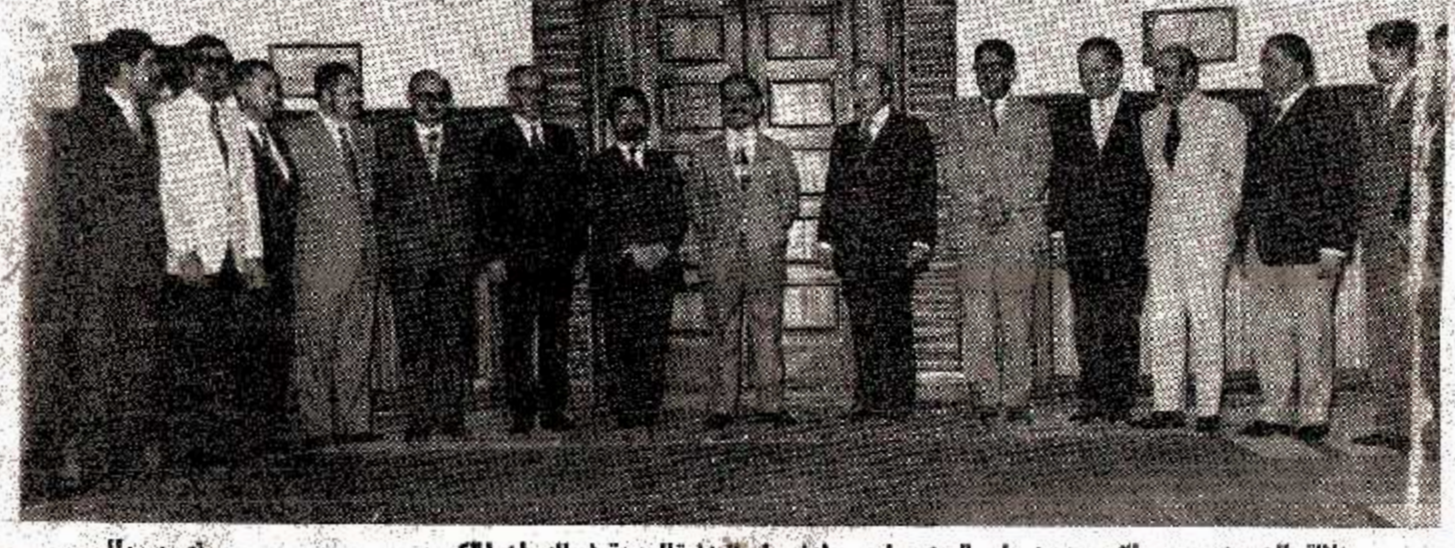
جلالة الحسين وسمو الأمير حسن ولي العهد ورئيس وأعضاء الوزارة الجديدة في الديوان الملكي - تصوير ١١ -

الرئيس الرفاعي : سنجعل العلم والعقل والأرادة وسائل العمل والبناء والانتاج