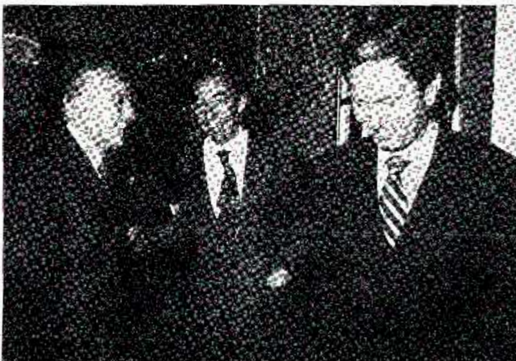
El embajador de Argentina con el príncipe de Baviera y el marqués de Llanzo.