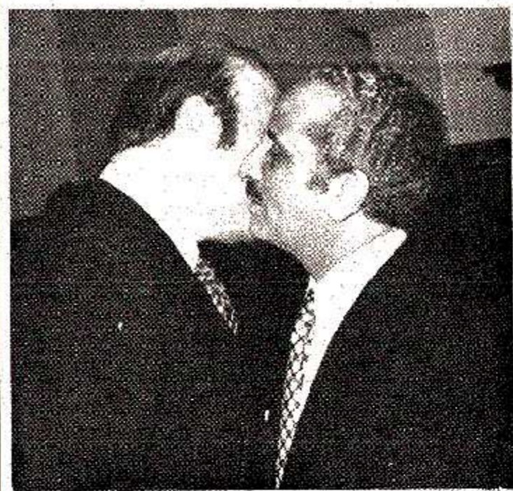
رئيس الوزراء يزور منزل الرئيس الوزري قام دولة السيد زسد الرفاعي رئيس الوزراء بعد ظهر امس بزيارة دولة السيد احمد اللوزي في منزله حيث امضى فترة من الوقت مع عائلته بعد ما موعدا بالزيارة والتكريم.

صرح السيد غازي الرفاعي وكيل وزارة النقل المساعد بأنه سيتم اليوم في وزارة النقل التوقيع على اتفاقية مع بنك الامارات الاتلاني - كريدبيت انشالت بنك - قيسها اربعة ملايين مارك ونصف وذلك لتمويل الدراسات اللازمة لإنشاء مطار عمان الدولي الجديد. وسيقوم الائتلاف ثمانية عن الحكومة اربعة السيد نديم الزرو وزير النقل والكوتور بيتر اهد مدراء بنك الامارات الاتلاني. وسيجهر براسيم التوقيع على الائتلافية السفير الميث شبليل سفير المانيا الاتلانية في عمان وكبير المسؤولين في وزارة النقل.