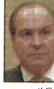
الذي طاله اشد انواع الظلم وهو في قلب «قصر العدل»