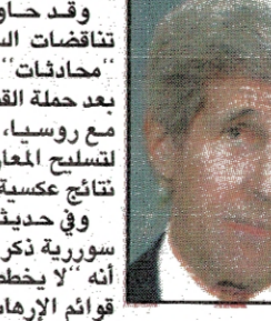
سربت صحيفة نيويورك تايمز تسجيلات صوتية لثقت لوزير الخارجية الامريكي جون كيري اثناء لقائه مع عشيرين من المعارضين السوريين، بالإضافة الى عدد من الدبلوماسيين، حيث دام اللقاء ٤٠ دقيقة في مقر البعثة البولندية داخل مبنى الأمم المتحدة في يوم ٢٢ ايلول الماضي، في هامش اجتماعات الدورة السنوية للجمعية العامة.

وعادها في سورية بناء على دعوة من الحكومة السورية، وقد حاول بعض الموجودين ثني كيري عن تناقضات السياسة الامريكية، الا انه عاد ليؤكد ان «محادثة» تجري داخل اروقعة الارباب الامريكية بعد حملة القصف المكثفة على حلب وانهيار المحادثات مع روسيا، ثم استورد قائلاً: ان اي جهد امريكي لتسليح المعارضة او الانضمام الى القتال قد يؤدي الى نتائج عكسية. وفي حديثه عن الجماعات والمليشيات المقاتلة في سورية ذكر ان موقف الولايات المتحدة من حزب الله انه «لا يخطئ ضمناً» على الرغم من انه يندرج ضمن قوائم الارهاب الامريكية، اما تنظيم داعش والقاعدة، فقد طلب كيري من المعارضة مساعدتها على محاربة هذين التنظيمين لانها «اعلن الحرب على الولايات المتحدة». وفي اشارة الى مدى إصحاظته قال كيري: «نحاول استخدام الدبلوماسية وأهم ان هذا مدعاة للإحباط، لكن لا يوجد أحد يشعر بالإحباط أكثر مني» ثم خاطب الحضور قائلاً: «عليكم ان تقاتلوا من اجلنا لكننا لن نقاتل معكم» بحسب ما ذكر أحد الحضور الجلسة. كما ذكر أحد المشاركين في اللقاء ان كيري يندمج بالقول: ان أفضل أمل بالنسبة للمعارضة السورية هو القول بحل سياسي لإدخال المعارضة في طور حكومة انتقالية وأضاف: «حينها ستصبح امامكم انتخابات وانتقروا الشعب السوري بغفر من الذي يريد». وبعد ذلك التفت كيري على الحضور مشاركته في انتخابات تشمل الرئيس بشار الأسد، وقال لا أحد من الإيجئين السوريين سيقوم بانتخابه، بينما ترك الحضور في دهول تام واحباط من السياسة امريكية تجاه سورية التي طالما طالب الرئيس الأسد بالتحتي !!