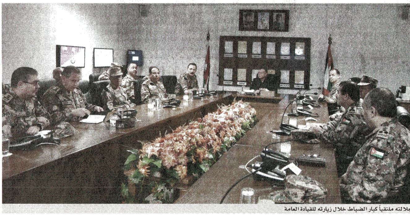
جلالته متقبلاً كبار الضباط خلال زيارته للقيادة العامة

عمان - بترا - زار جلالته الملك عبدالله الثاني، القائد الأعلى للقوات المسلحة امس الاثنين، القيادة العامة للقوات المسلحة الأردنية-الجيش العربي وكان في استقبال جلالته مستشار جلالته الملك للشؤون العسكرية رئيس هيئة الأركان المشتركة الفريق أول الركن مشعل محمد الزين - وسمو الأمير فيصل بن الحسين.