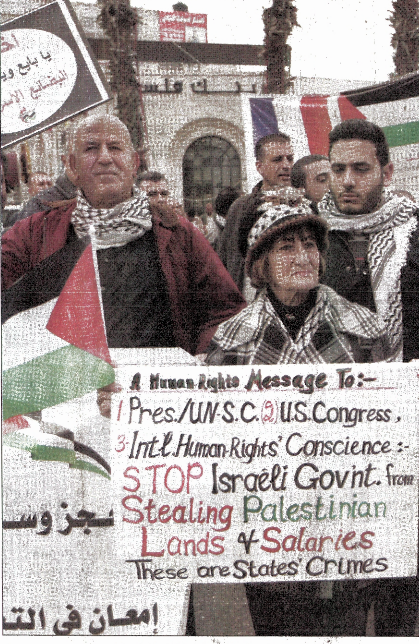
مظاهرة في رام الله احتجاجاً على العقوبات الاسرائيلية ضد السلطة الفلسطينية «أ ف ب»

ضوء أخضر لتسعين مستعمرة بـ 840 بؤرة استيطانية فلسطين المحتلة - قدمت ما يسمى بوزيرة الهجرة والاستيعاب الصهيونية سوزا لاندير لحكومة الاحتلال اقتراح قانون «طوارئ قومي» اطلق عليه اسم «فرنسا أولا» يتم بموجبه تهجير نحو 120 ألف مهاجر من يهود فرنسا إلى فلسطين.