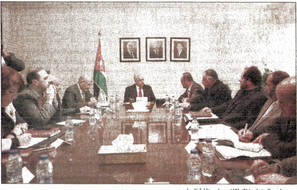
رئيس الوزراء خلال لقائه مجلس نقابة المعلمين

عمان - الدستور - حمدان الحاج التقى رئيس الوزراء الدكتور عبدالله النسور في دار رئاسة الوزراء أمس الاثنين نقابة وأعضاء مجلس نقابة المعلمين. وأكد رئيس الوزراء أنه كان من المويدين لإنشاء النقابة، مؤكداً عدم استخدام الطالب رهينة لتحقيق مطالب الانجازات التي تحققت وتعزيز المكانة الاجتماعية للمعلمين. كما أكد ان الاهتمام بالتعليم والنهوض به احتل دوماً سلم الاولويات في الدولة الاردنية التي استثمرت بالانسان الاردني وتعلمه وتسليحه بكل صنوف المعرفة حتى اصبح الاردن في مقدمة الدول في مجال التعليم العام والتعليم الجامعي ومحو الامية لافتاً الى ان النقابة يجب ان تركز