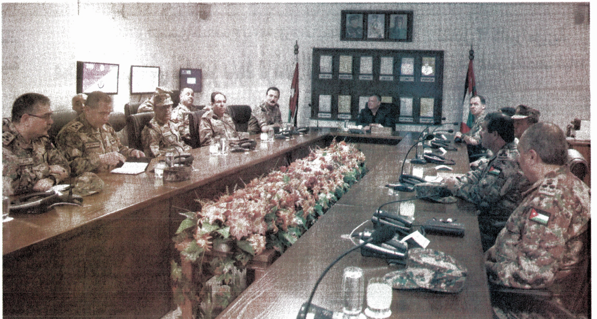
القائد الأعلى للقوات المسلحة جلالة الملك عبد الله الثاني خلال زيارته للقيادة العامة