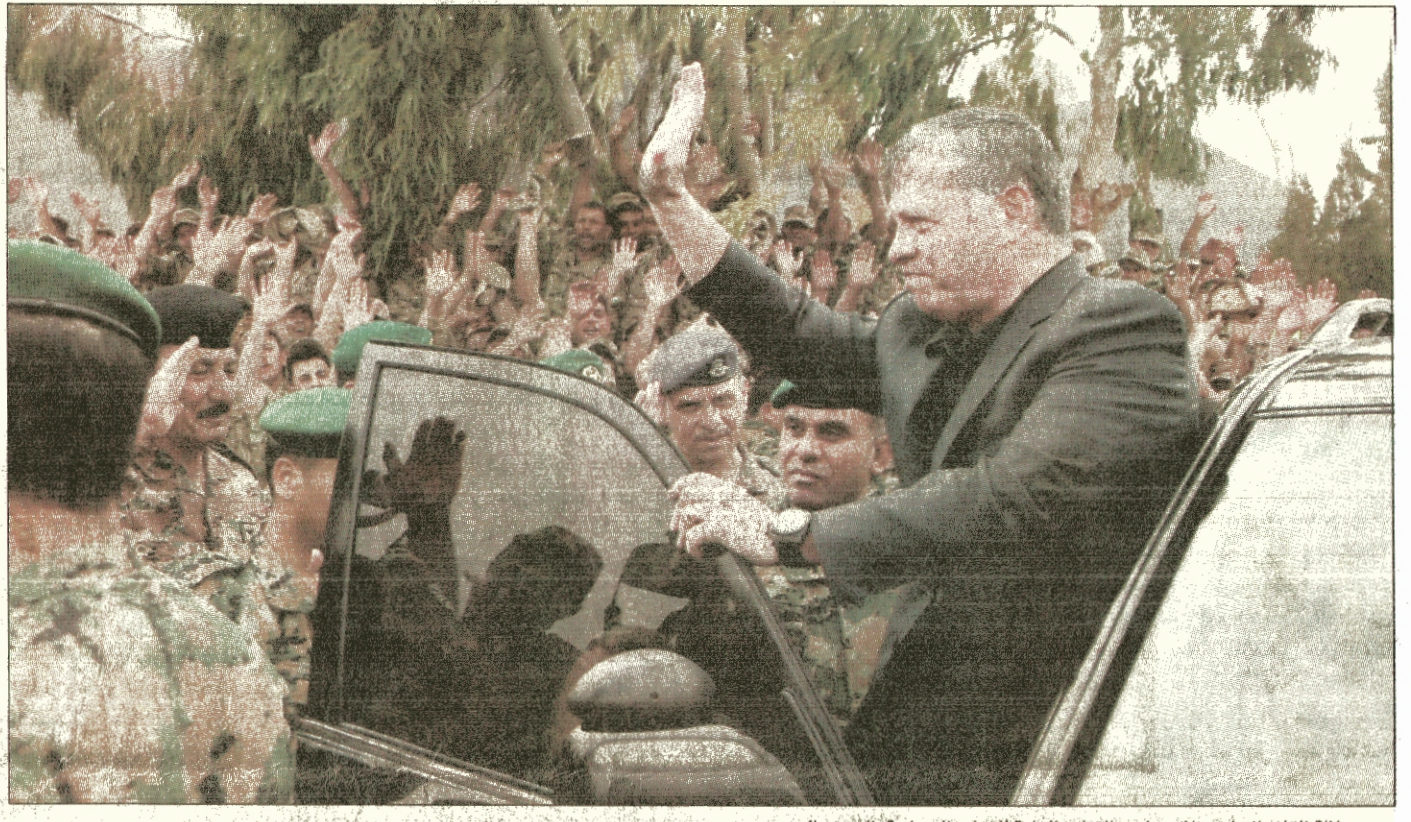
جلالة القائد الاعلى خلال زيارته القيادة العامة للقوات المسلحة الجيش العربي

مكافحة الإرهاب والتطرف شأن عربي وإسلامي بالدرجة الأولى