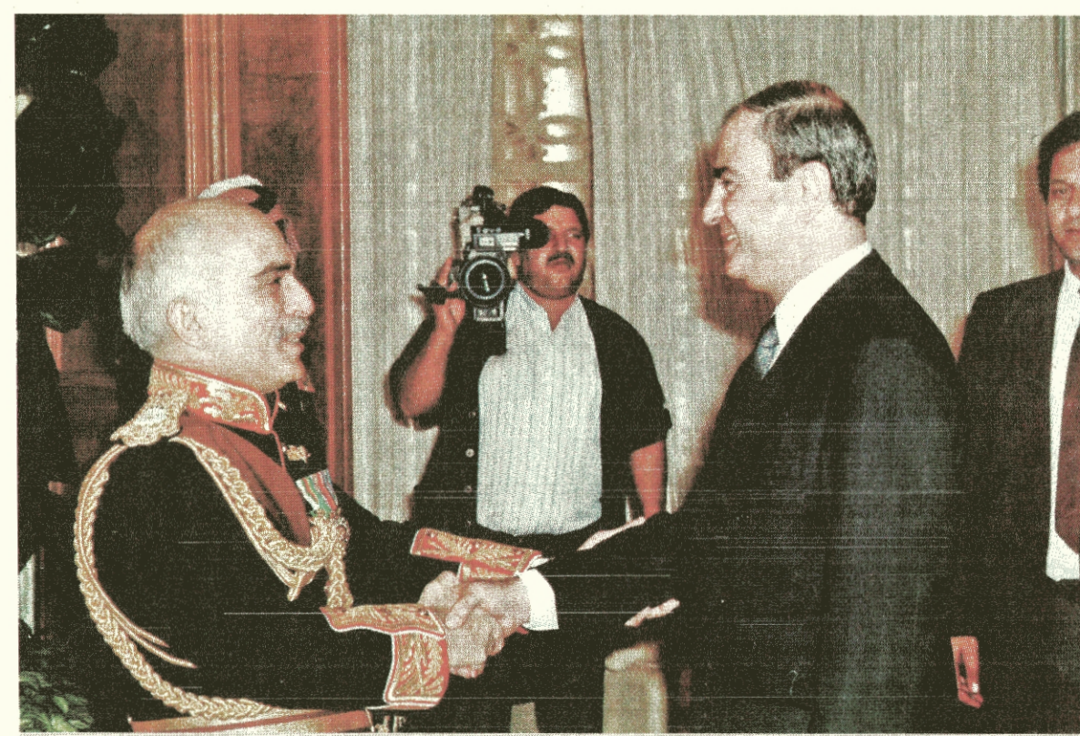
المفقور بل يأن الله الملك الحسين مصافحاً المصري (أرشيفية)

منذ عملي في وزارتي الأولى، وعملي سفيراً في ثلاث عواصم اوروبية هي مدريد، باريس، لندن، لمدة عشرة سنوات، تشكلت عندي قاعدة معلومات، وخبرة سياسية، تكفي لأن اتبوا موقفاً سياسياً مهماً كوزارة الخارجية، وكانت علاقاتي مع الملك الحسين تتطور، حتى أعرضني بقبول الوزارة، بعد ذلك بدأت اتعلم من مدرسة الملك الحسين - رحمه الله - وبدأت وتيرة تعاملي معه تقترب من التعامل المباشر، والاحتكاك المباشر، وهذا استمر لمدة خمس سنوات وهي الفترة التي توليت فيها وزارة الخارجية. لا شك