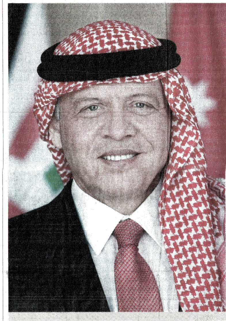
عمان - بترا - هنأ جلالة الملك عبدالله الثاني، خلال اتصال هاتفي امس، سمو الأمير محمد بن سلمان بن عبدالعزيز آل سعود باختياره ولياً لولي العهد، وتعيينه نائباً ثانياً لرئيس مجلس الوزراء ووزيراً للدفاع في المملكة العربية السعودية الشقيقة.