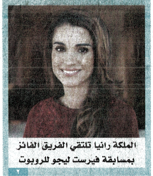
الملكة رانيا تلقتي الضيق الفائز بمسابقة فيرست ليجو للروبوت

عمان - طارق الحميدي أعلنت نقابة المهندسين عن فتح باب الترشح لانتخاب رئيس لهيئة المكاتب والشركات الهندسية في النقابة اعتباراً من صباح اليوم الأربعاء ولغاية نهاية دوام يوم الثلاثاء الموافق ١٢ الشهر الجاري. وقررت النقابة إجراء الانتخابات يوم السبت الموافق ١٦ الشهر الجاري من الساعة ٩ صباحاً ولغاية الساعة ٦ مساءً. وكان مجلس نقابة المهندسين قرر إعادة الانتخاب لمركز رئيس هيئة المكاتب والشركات الهندسية في النقابة بعد قبوله الطعن المقدم من عدد من المهندسين أعضاء الهيئة العامة لأصحاب المكاتب والشركات الهندسية في ٢٦ الشهر الماضي على الانتخابات وخاصة ما يتعلق بعدم توفر الشروط القانونية لمكتب المهندس قاهر صفا. (التفاصيل ص٢)