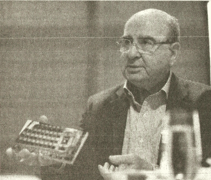
طاهر المصري يتحدث لـ "الغد" ضمن سلسلة حلقات "سياسي يتذكر"

المصري، لكشف النقاب عن قضايا عاصرها، ولم يعلق عليها من قبل. ويتناول المصري، الذي عايش بعيني الطفل، آثار نكبة فلسطين، وتابع تحقّق اللاجئين الفلسطينيين في الداخل والخارج، وسافر طالبا وعام موظفا، وترشح في الانتخابات التكميلية لمجلس نواب (الضفتين) العام 1973، ثم عين وزيرا في حكومة زيد الرفاعي الأولى، من العام نفسه، وبعدها عين سفيراً في مدريد وباريس ولندن. وهي المحطات، التي أهلته ليعود وزيرا للخارجية بحكومة أحمد عبيدات، ويستمر في موقعه حتى تقديم "استقالته" من حكومة زيد الرفاعي، على خلفية قرار فك الارتباط، لينقذه ذلك الخروج، ويعيده إلى حكومة زيد بن شاكور الأولى، نائبا لرئيس الوزراء، ثم وزيرا للخارجية في حكومة مضر بدران الرابعة، ثم رئيسا للحكومة التي قررت المشاركة في مؤتمر مدريد للسلام، تمهيدا ليكون رئيسا للدورة الأولى لمجلس النواب الثاني عشر العام 1993. ليواصل بعد هذه المحطات مشواره السياسي كقريب من مراكز القرار، حتى أبعدته عنها مواقف اتخذها دون مواربة أو اختباء؛ تحديدا بعد توقيع معاهدة السلام الأردنية الإسرائيلية، وإقرار قانون المعاهدة.