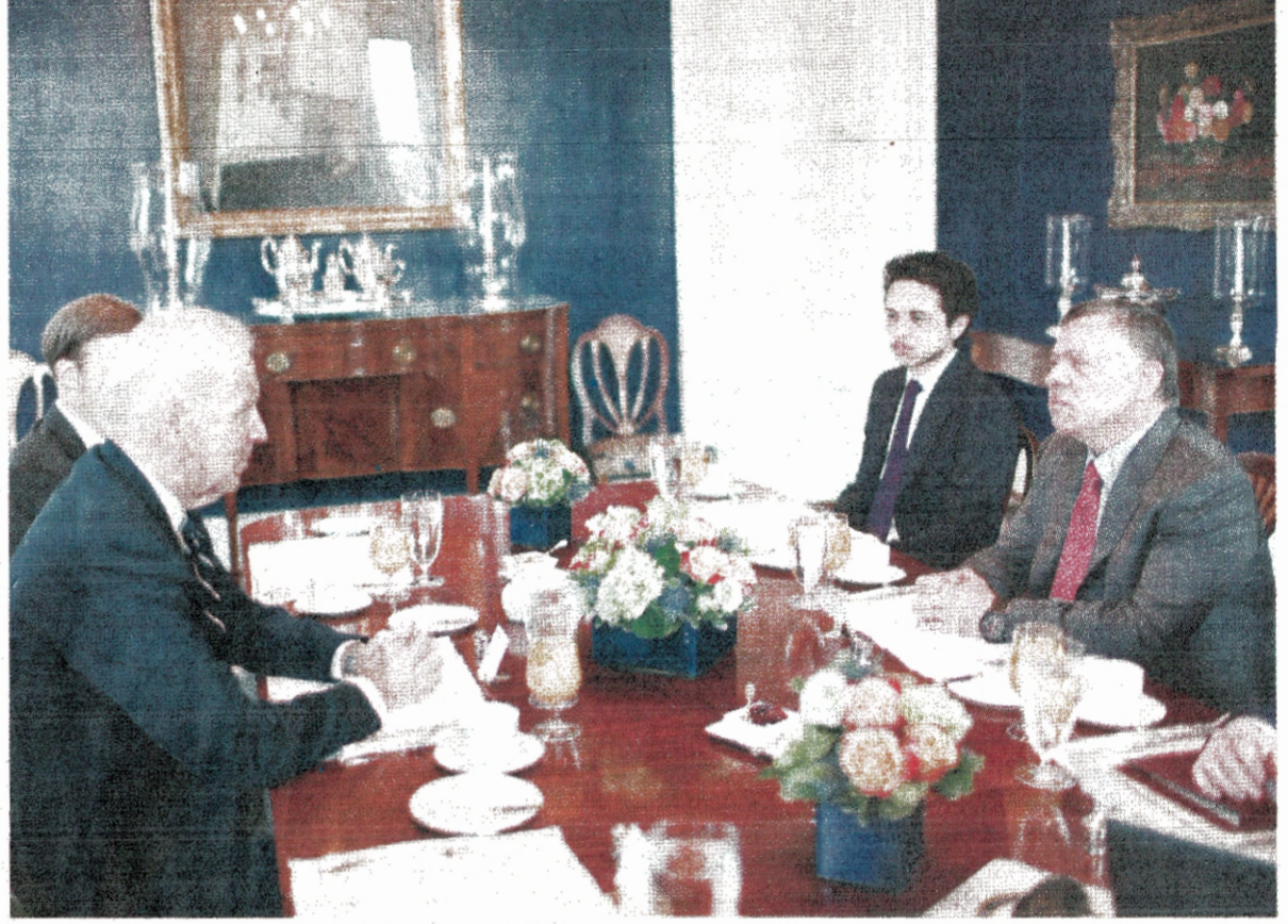
الملك يلتقي نائب الرئيس الأميركي جو بايدن بحضور ولي العهد سمو الأمير الحسين بن عبدالله الثاني بواشنطن أمس

واشنطن - أكد جلالته الملك عبدالله الثاني أن إقامة الدولة الفلسطينية التي تعيش بأمن وسلام إلى جانب إسرائيل، هي مصلحة إقليمية وعالمية لتحقيق السلام وتعزيز أمن واستقرار المنطقة، استنادا إلى حل الدولتين وقرارات الشرعية الدولية ومبادرة السلام العربية. جاء ذلك، خلال لقاءات جلالته بحضور سمو الأمير الحسين بن عبدالله الثاني، ولي العهد، مع نائب الرئيس الأميركي جو بايدن وقيادات في الكونغرس الأميركي أمس وأول من أمس. ويحدث جلالته، مع بايدن مستجدات الأوضاع في الشرق الأوسط، خصوصا ما يتصل بجهود تحقيق السلام، وتطورات الأزمة السورية، وعدد من القضايا الإقليمية، إضافة إلى العلاقات الأردنية الأميركية الاستراتيجية وسبل تطويرها في مختلف المجالات. كما التقى جلالته، رئيس مجلس النواب الأميركي جون بينر، وقيادات الحزب الجمهوري في المجلس، إضافة إلى رئيس لجنة الشؤون الخارجية في مجلس النواب إدوارد رويس وأعضاء اللجنة. وجرى خلال اللقاءين المنفصلين بحث تطورات عملية السلام في الشرق الأوسط والجهود الأميركية في هذا المجال، مؤكدا جلالته