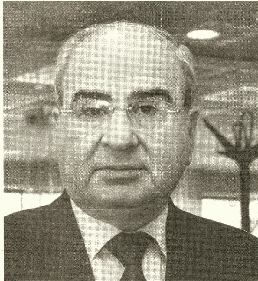
رئيس الوزراء الأسبق طاهر المصري - (ارشيفية)