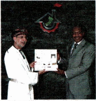
الاتحاد الدولي للاتصالات يشيد بالتجربة العمانية في تقنية المعلومات