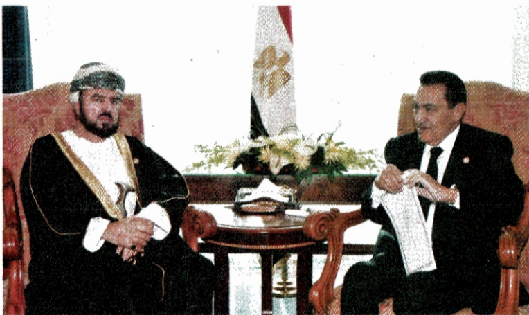
مبارك لدى استقباله أسعد بن طارق