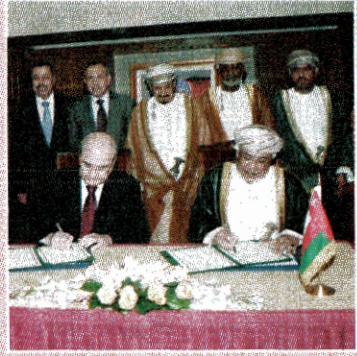
مذكرة تفاهم بين السلطنة والأردن لدعم التعاون البرلماني