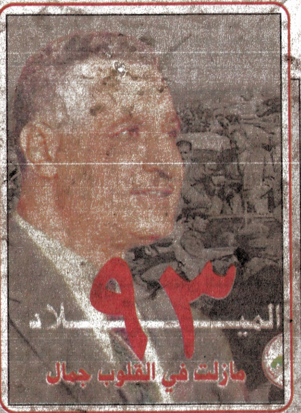
مازلت في القلوب جمال