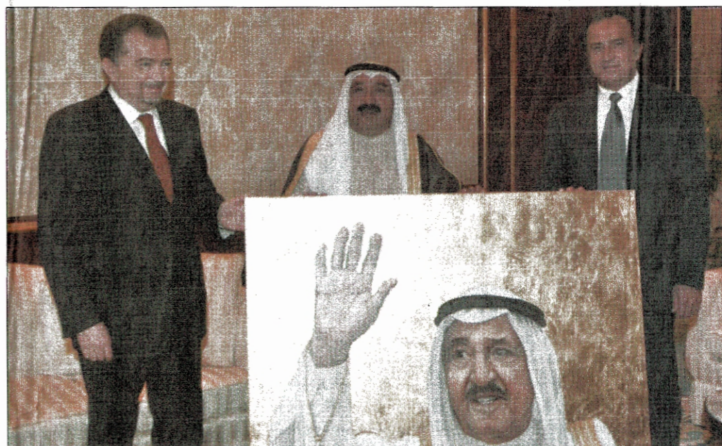
■ وزير الديوان الأميري مستقبلا السفير الإيطالي