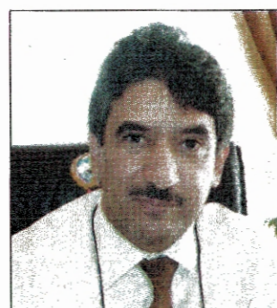
■ السفير سالم الزمانان

مؤكدا دعم بلاده ايضا لمشاريع البنية التحتية في اليمن. وقال ان دولة الكويت منذ القدم وهي سباقة في بناء وانشاء عشرات المدارس والراكز التعليمية والصحية والاسود والطرق اضافة لدعم انشاء كلية الطب في جامعة صنعاء التي تعد واحدة من اكبر الكليات في المنطقة. ودول الطلبة الكويتيين الدارسين في اليمن ذكر ان هناك بعض الطلبة يدرسون في اليمن على حسابهم الخاص داعيا اي مواطن كويتي يحمل الى اليمن ان يتصل بالسفارة ويضع بياناته وعنوانه وذلك للتواصل معه.