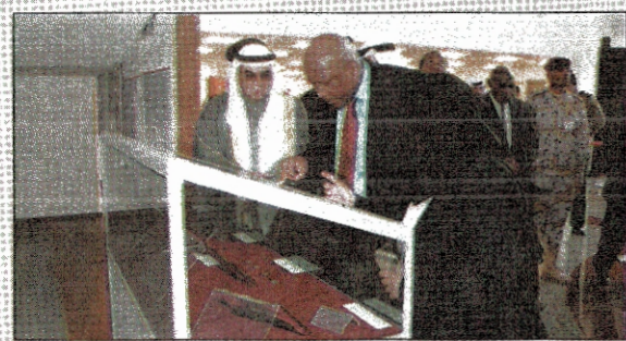
■ جانب من جولة الملك ليسيتي الثالث في المتحف العلمي

قام ملك ليسوتو ليسيتي الثالث والوفد الرسمي المرافق له بزيارة الى متحف الكويت الوطني صباح امس وقد رافق خلال الزيارة رئيس بعثة الشرف المرافقة المستشار بالديوان الأميري خالد يوسف الفليح.