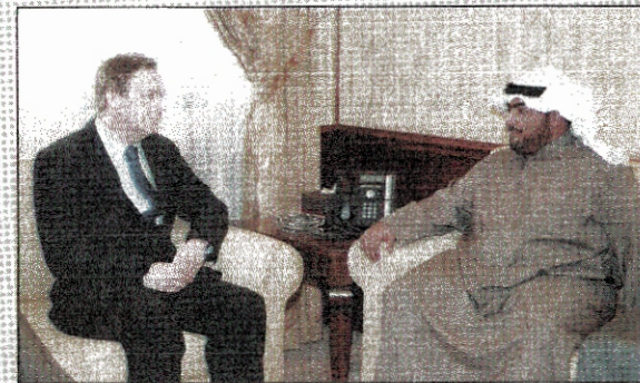
■ الشيخ ثامر العلي مستقبلا باتريك ويلسون

استقبل نائب رئيس جهاز الأمن الوطني الشيخ ثامر العلي امس مستشار مبعوث اللجنة الرباعية في الشرق الاوسط باتريك ويلسون، وتم خلال اللقاء الذي حضره سفير بريطانيا لدى البلاد فرانك بيكر بحث آخر المستجدات والتطورات على السامتين الاقليمية والدولية والخصائيا المتعلقة بمنطقة الشرق الاوسط.