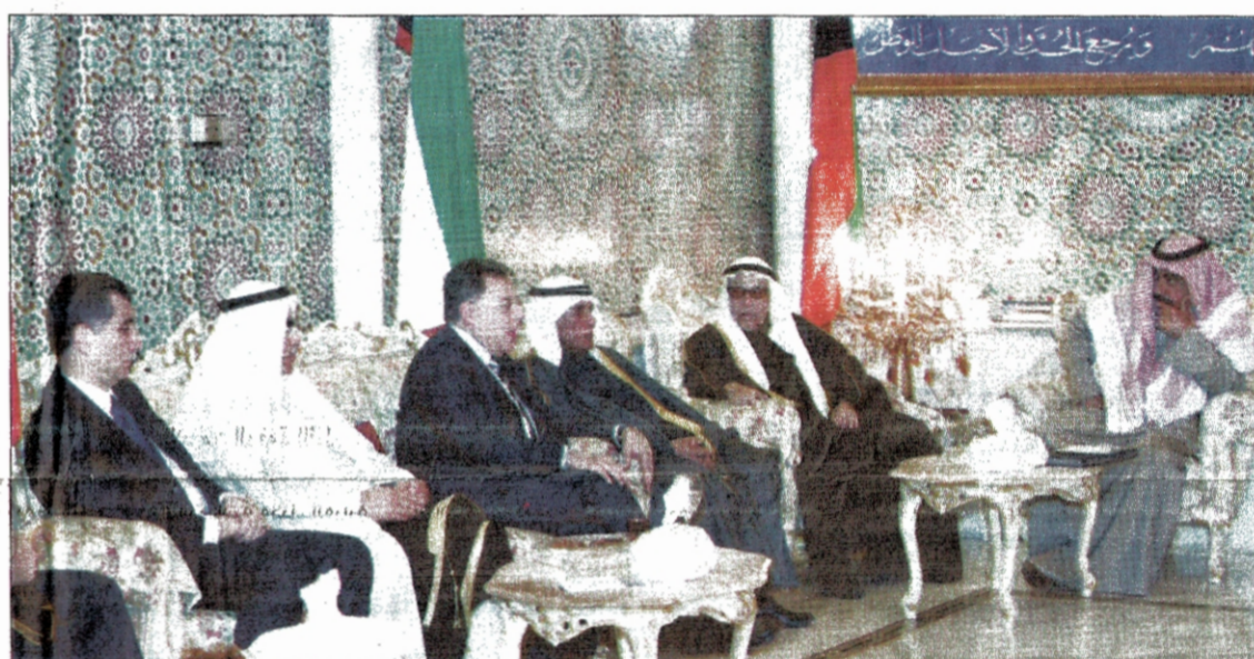
كتب- شوقي محمود:

«أموال الزمان عليك شتى.. وحالك واحد في كل حال». بيت الشعر السابق اجاب رئيس وزراء لبنان السابق فؤاد السنيورة على سؤال الصحافيين امس عقب انتهاء اجتماع مجلس العلاقات العربية الدولية عن تغير نبرة الخطاب اللبناني تجاه سورية، مؤكداً ان لهجته ومنطقاته وعباراته لم تتغير على الاطلاق، وانه ما زال من أشد المؤمنين باستقلال لبنان وسيادته وعرويته ودوره في العالم العربي. وفي رده على سؤال حول تقييمه للقاء