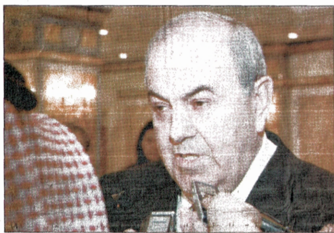
كتب- شوقي محمود:

نفي رئيس الوزراء العراقي الاسبق د. اياد علاوي ان تكون قائمته قد انسمحت من انتخابات مجلس النواب العراقي المزمع اقامتها خلال الشهر المقبل، في حين اوضح ان قائمته علفت خوض هذه الانتخابات وطلبت عقد اجتماعات للتراسات الثلاث، الجمهورية والحكومة والنواب، وقد وصلت اجابات من رئاسي الجمهورية والنواب وفي انتظار جواب رئاسة الوزراء لمناقشة مختلف الامور والخروج من الوضع الحالي المتأزم على الساحة العراقية استعداداً للانتخابات.